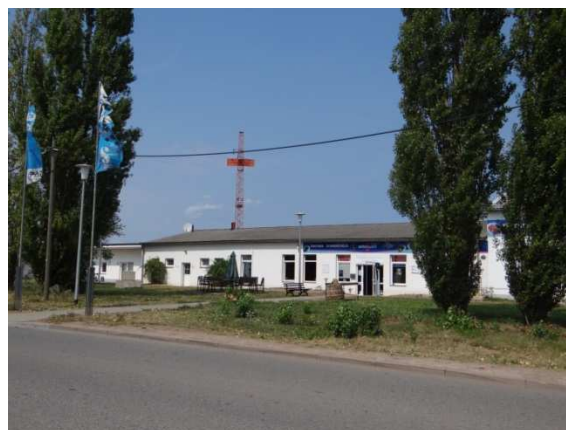
Gebäude des Tauchsportzentrums „actionsport“ mit Pension