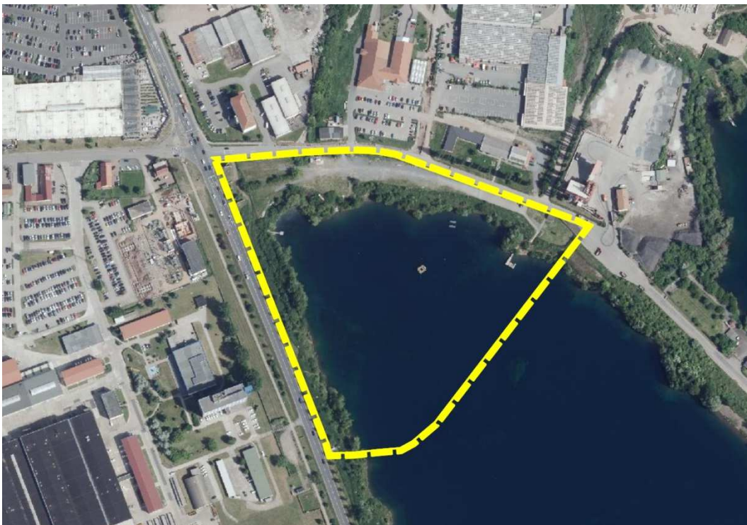
Luftbild zur Lage des Plangebietes

Das Plangebiet selbst stellt sich als bereits deutlich durch regelmäßige Nutzung in Anspruch genommene Flächen dar. Ein überwiegender Teil ist wasserdurchlässig durch Schotterflächen befestigt. Davon ausgenommen sind die direkten Uferböschungen mit dem entsprechenden Bewuchs an einheimischen Gehölzen. Diese sollen auch künftig erhalten und geschützt werden.