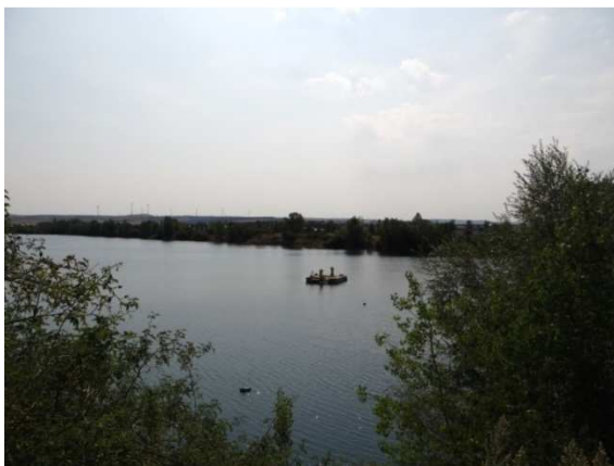
Tauchrevier Sundhäuser See

Auf Grund der hohen Resonanz und guter Entwicklungsprognosen macht es sich erforderlich, die Anlage entsprechend zu erweitern und zu entwickeln. Geplant ist, die geordnete Errichtung von Zelt- und Caravanstellplätzen mit entsprechenden sanitären Einrichtungen und Nebenanlagen. Dazu plant der Vorhabenträger für das Tauchsportzentrum „actionsport“ die Errichtung eines Sanitärgebäudes sowie von maximal 5 kleineren Servicegebäuden für den Tauchsport im Bereich des Nordufers des Sundhäuser Sees. Die 5 Servicegebäude werden jeweils nur in einer Größe von maximal 40m 2 Grundfläche errichtet und dienen als